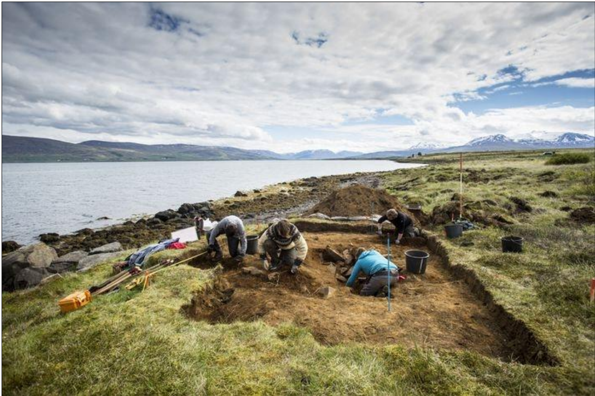
Mynd 8 Uppgröftur og skráning fornleifafraeðinga á víkingagröfum á Dysnesi.

Í umhverfismatsskýrslu verður sýnd afstaða framkvæmda til skráðra og þekktra minja og metin áhrif, fyrst og fremst af beinu raski við framkvæmdir. Í umhverfismatsskýrslu verður greint frá niðurstöðum skráninga og lagt mat á hversu mikil hætta skapast á að minjar raskist við framkvæmdir.