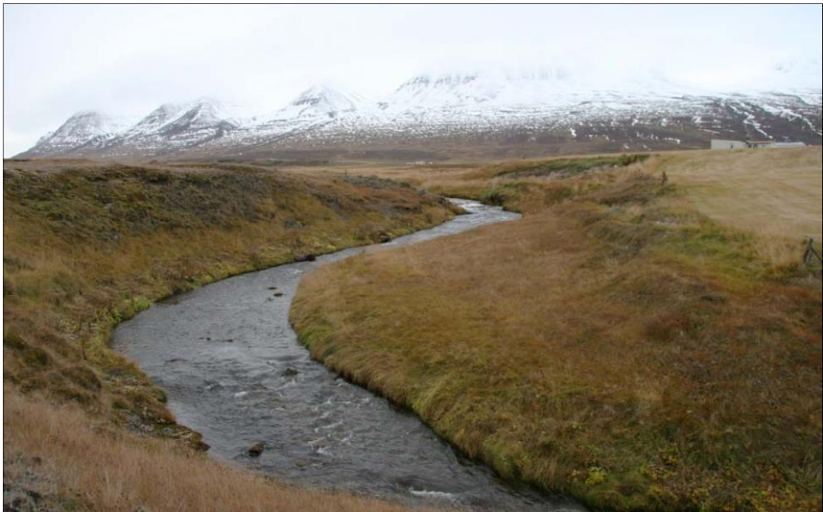
Mynd 3 Pálmholtslækur liðast um suðurmörk Dysness.