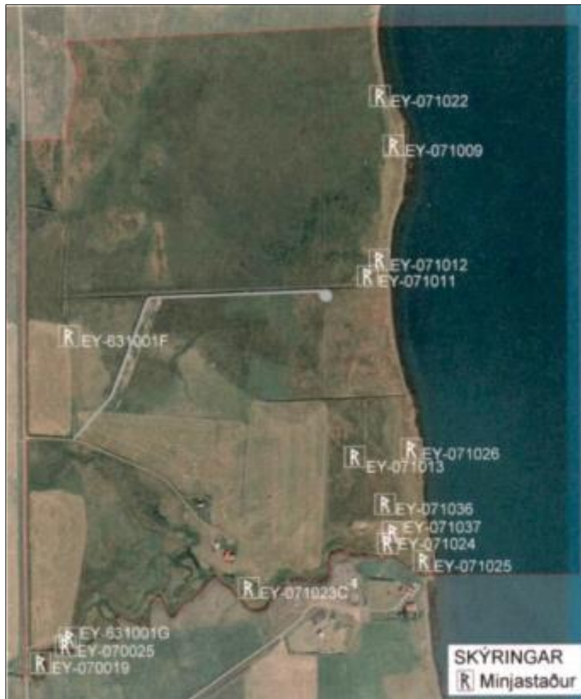
Mynd 7 Skráðar fornleifar innan skipulagssvæðisins.

Dysnes EY-071-009 er svæði með mjög mikið varðveislu- og rannsóknargildi en það hefur ekki verið rannsakað.