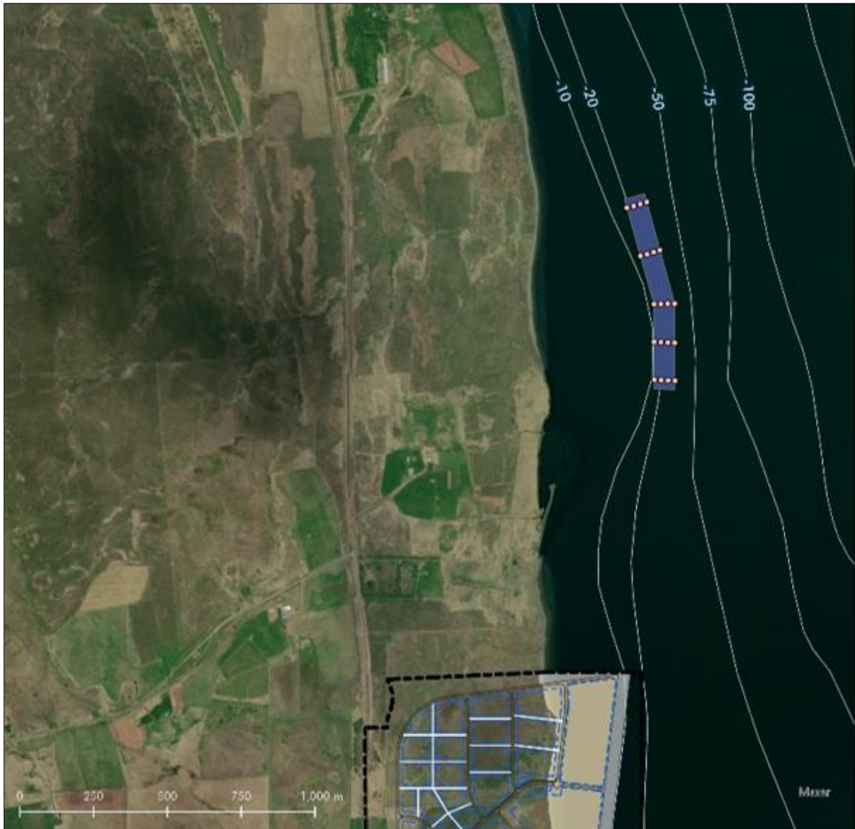
Mynd 6 Efnistökusvæðið afmarkað á skematískan hátt.

Miðað er við að stærð efnistökusvæðisins verði 0,04 km 2 . Það svæði er litað fjólublátt og fyrirhugaðar rannsóknarholur eru litaðar með bleikum lit á mynd 6.