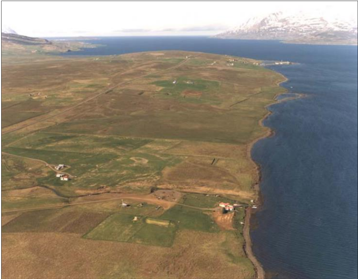
Mynd 2 Yfirlitsmynd af Dysnesi. Bærinn Litli-Hvammur er í forgrunni, sunnan megin Pálmholtslækjar. Norðan lækjarins er bærinn Gilsbakki. Í fjarska er Hjalteyri. (Almenna verkfræðistofan, 2005).