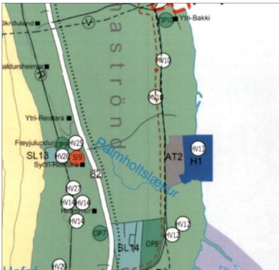
Mynd 4 Yfirlitsmynd landnotkunar. Deiliskipulag hafnar-, athafna og iðnaðarsvæðis á Dysnesi.

Skipulag svæðisins gerir ráð fyrir uppbyggingu hafnar-, athafna- og iðnaðarsvæðis ( mynd 4 ). Athafna- og iðnaðarlóðir eru í umsjá sveitarfélagsins Hörgársveitar og lóðir fyrir hafnsækna starfsemi, athafna- svæði hafnar og hafnarbakkasvæði eru í umsjá Hafnasamlags Norðurlands. Um er að ræða fjölbreyttar lóðir af mismunandi stærð sem geta aðlagast að fjölbreyttri starfsemi. Stærð hafnarsvæðisins er um 52 ha og athafna- og iðnaðarsvæðið er um 34 ha. Starfsemin á lóðunum fellur undir skilgreinda landnotkun sbr. 6.2. gr. skipulagsreglugerðar nr. 90/2013 auk þess sem takmörk eru sett við mengandi starfsemi á iðnaðarlóðum.